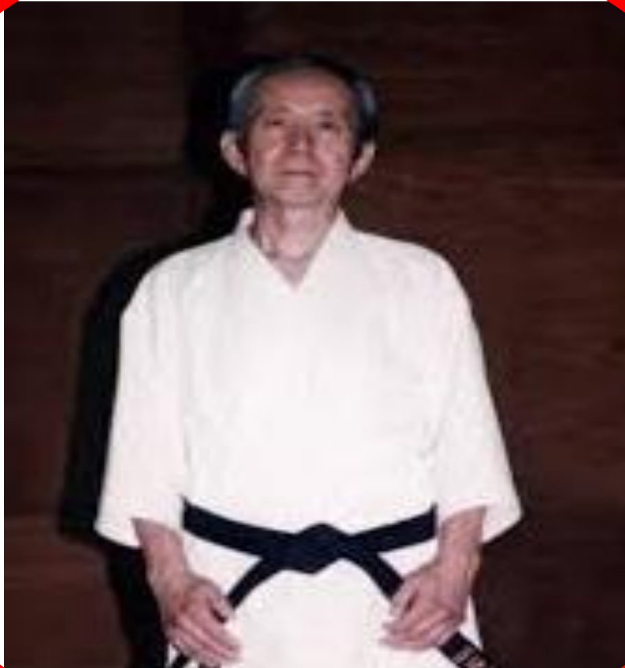
MAESTRO HIDEO TSUCHYA